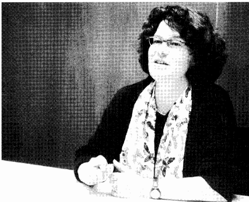
Ruth Genner, dipl. Lebensmittel-Ingenieurin ETH, ist heute in der Gesundheitsförderung tätig. Von 1987–1997 war sie in Zürich Kantonsrätin für die Grüne Partei. Seit 1998 ist sie Nationalrätin und Mitglied der Kommission für Verkehr und Fernmeldewesen.

Ruth Genner: Es gibt eine Vielzahl von Kräften, aber meiner Ansicht nach wird die Privatisierung vor allem von Anhängern des schlanken Staates gefördert. Hätten wir eine andere Führungskultur des Staates entwickelt, dann könnten wir anders Einfluss nehmen auf diese Institutionen. Beispiel Bahn: Im Eisenbahngesetz hat man den Regionalverkehr an die Kantone delegiert. Hier sehe ich mangelnden Führungswillen der